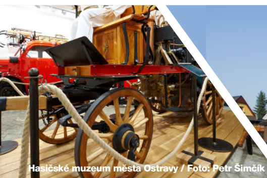
Hasičské muzeum města Ostravy