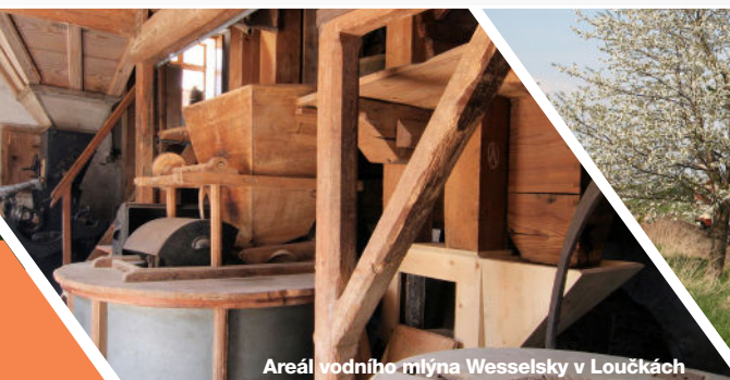
Areál vodního mlýna Wesselsky v Loučkách