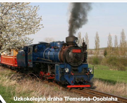
Úzkokolejná dráha Třemešná–Osoblaha