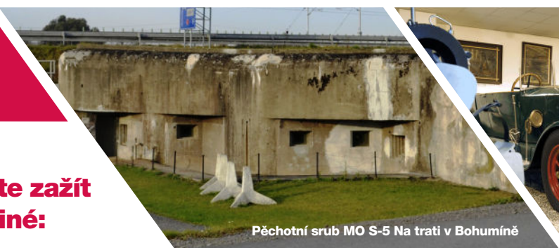
Pěchotní srub MO S-5 Na trati v Bohumíně