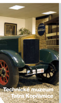
Technické muzeum Tatra Kopřivnice