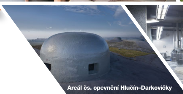
Areál čs. opevnění Hlučín–Darkovičky