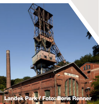
Landek Park