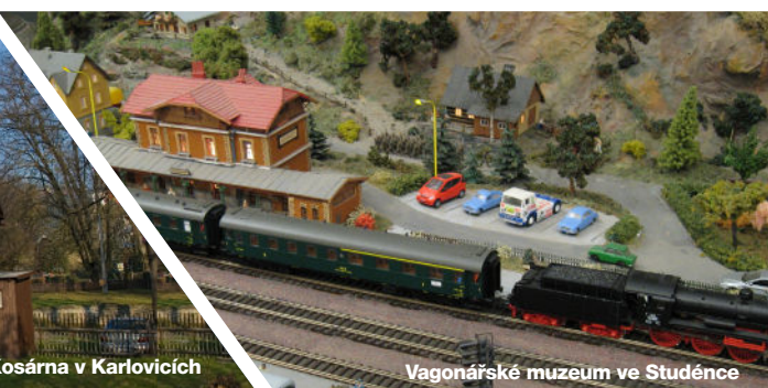
Vagonářské muzeum ve Studénce