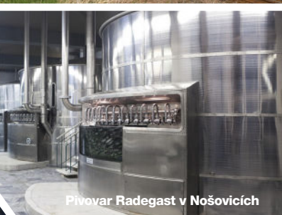
Pivovar Radegast v Nošovicích