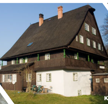
Kosárna v Karlovicích