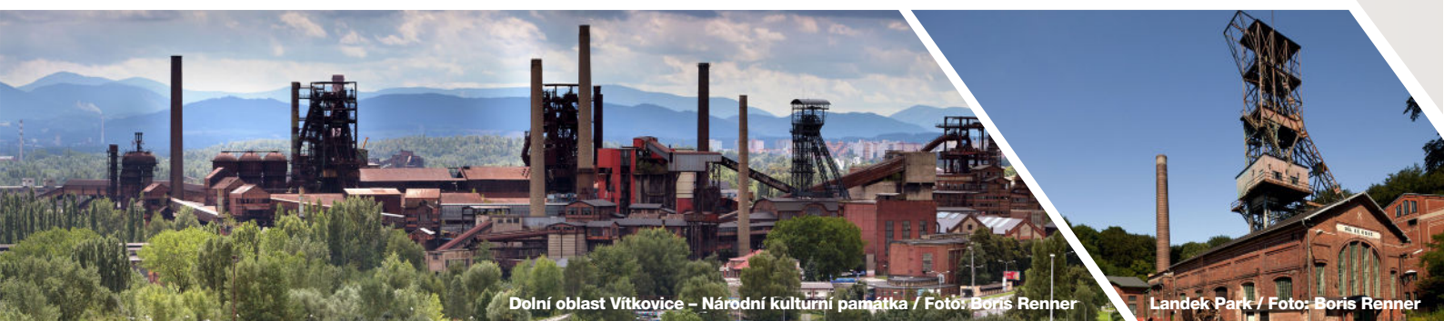
Dolní oblast Vítkovice – Národní kulturní památka